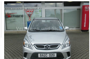
Autohaus Günter Gerhard / 02761-96690