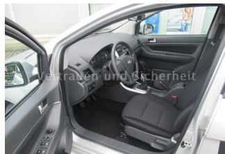
Autohaus Günter Gerhard / 02761-96690