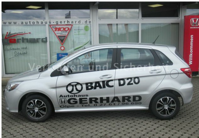
Autohaus Günter Gerhard / 02761-96690