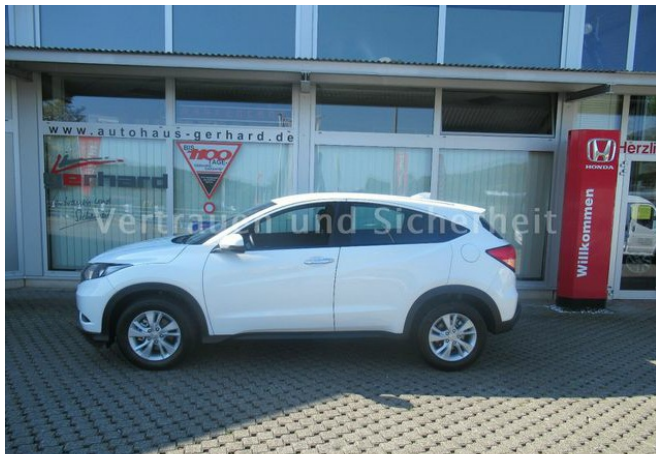
Autohaus Günter Gerhard / 02761-96690

Kundenorientierung und Verkaufserfolg Autohaus Günter Gerhard Kraftfahrzeughandel GmbH ★★★★★ Top-Händler Auszeichnung 2018 AUSZEICHNUNG 2017 Für hervorragende Leistung und Verkaufserfolg Autohaus Günter Gerhard Kraftfahrzeughandel GmbH