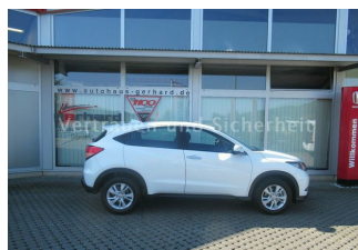
Autohaus Günter Gerhard / 02761-96690