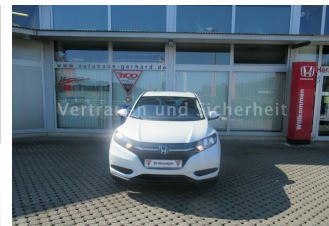
Autohaus Günter Gerhard / 02761-96690

Kundenorientierung und Verkaufserfolg Autohaus Günter Gerhard Kraftfahrzeughandel GmbH ★★★★★ Top-Händler Auszeichnung 2018 AUSZEICHNUNG 2017 Für hervorragende Leistung und Verkaufserfolg Autohaus Günter Gerhard Kraftfahrzeughandel GmbH