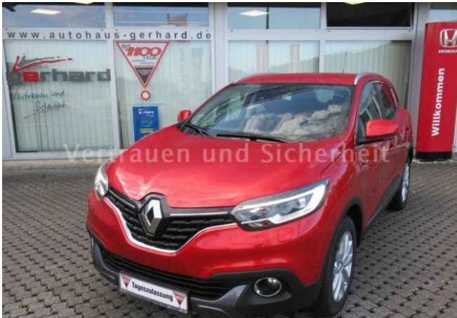
Autohaus Günter Gerhard / 02761-96690