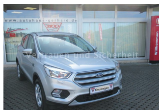
Autohaus Günter Gerhard / 02761-96690