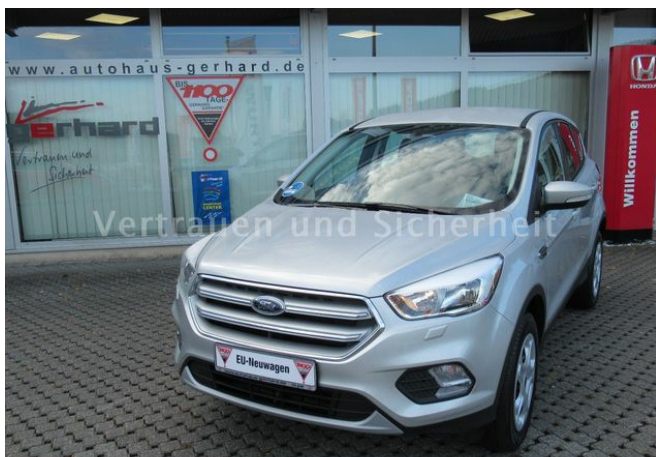
Autohaus Günter Gerhard / 02761-96690