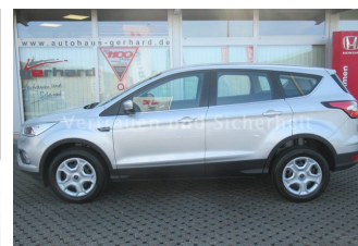
Autohaus Günter Gerhard / 02761-96690