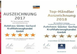
Autohaus Günter Gerhard /