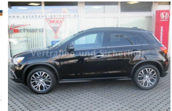
Autohaus Günter Gerhard / 02761-96690