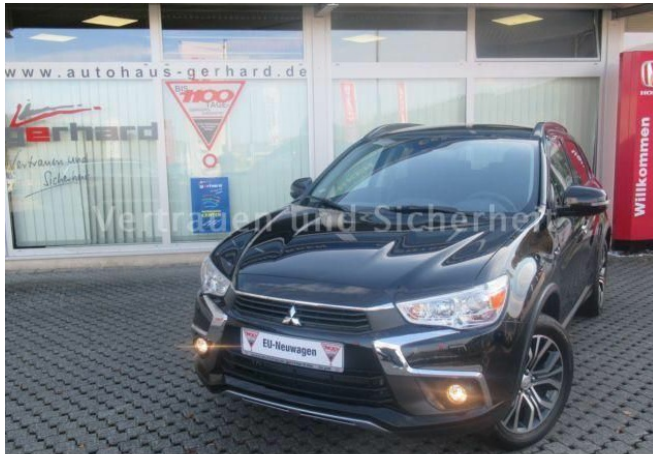
Autohaus Günter Gerhard / 02761-96690