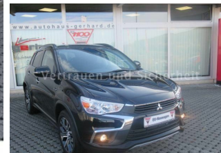
Autohaus Günter Gerhard / 02761-96690