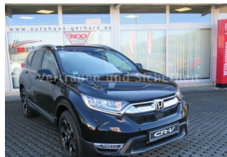
Autohaus Günter Gerhard / 02761-96690