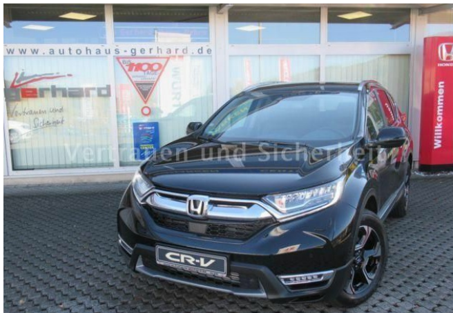
Autohaus Günter Gerhard / 02761-96690