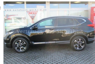
Autohaus Günter Gerhard / 02761-96690