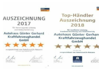
Autohaus Günter Gerhard /