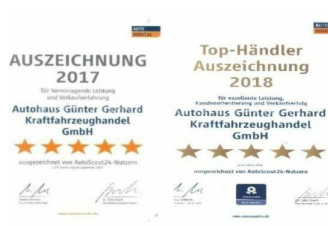
Autohaus Günter Gerhard /