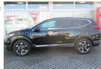
Autohaus Günter Gerhard / 02761-96690