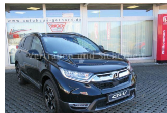
Autohaus Günter Gerhard / 02761-96690